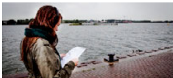
Amsterdam ontdekken met een koptelefoon op: verhalen begeleid door muziek en andere geluiden.