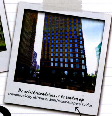
De geluidswandeling is te vinden op soundtrackcity.nl/amsterdam/wandelingen/zuidas

Deze is te downloaden als app voor smartphone of op verzoek als mp3 bestand.